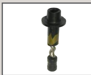
TORNILLO DE ACERO INOXIDABLE