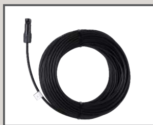
25 M CABLE CON CONECTOR MC4